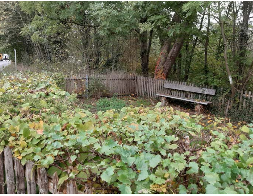
26 Die im Besitz der Stadt befindliche Fläche könnte zeitnah entwickelt werden. Eine Analyse hat ergeben, dass kein Bedarf nach einer Spielfläche besteht.