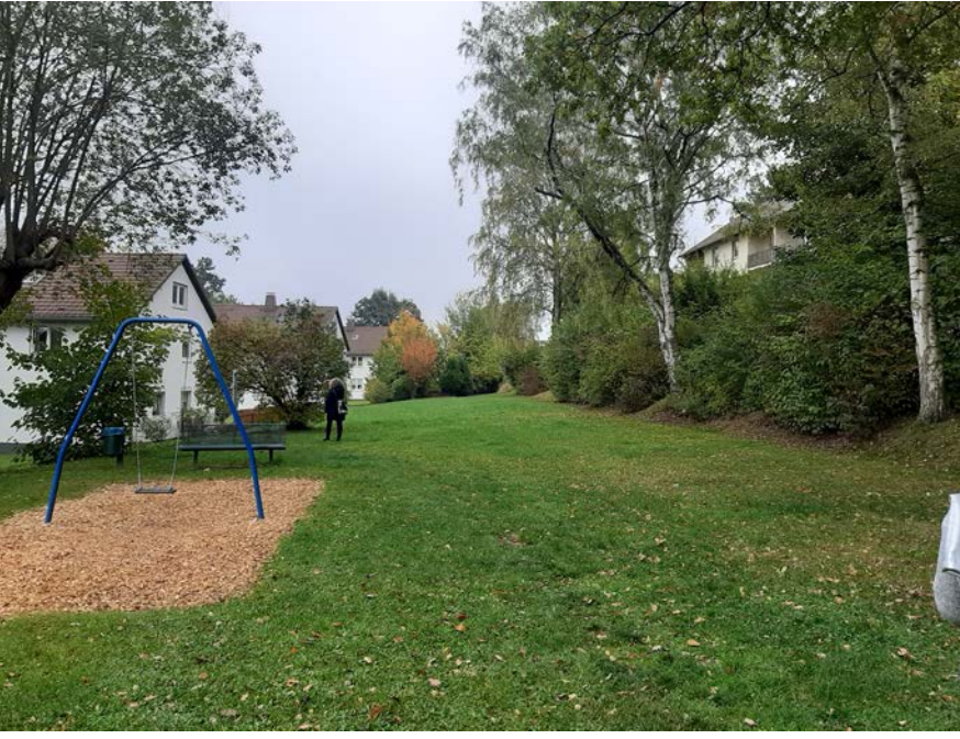
27 Neben mehreren Spielgeräten enthält der im Besitz des Bauvereins befindliche Spielplatz über eine große Wiese mit Erweiterungspotenzial.