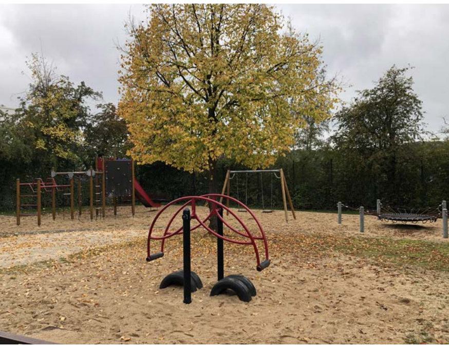
28 Der Spielplatz verfügt über ein vielfältiges Spielangebot. Außerdem wird der Spielplatz als Aneignungsfläche von Jugendlichen genutzt.