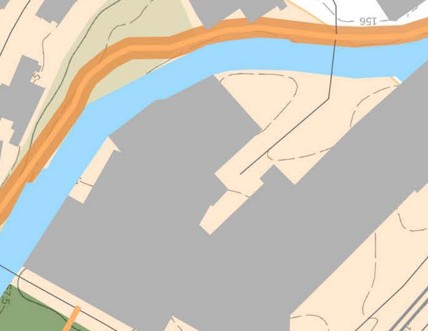
30 Der evangelische Friedhof ist terrassenartig gestaltet und bietet eine hohe Aufenthaltsqualität. Zugleich befindet sich der Friedhof in einer abgeschiedenen Lage.