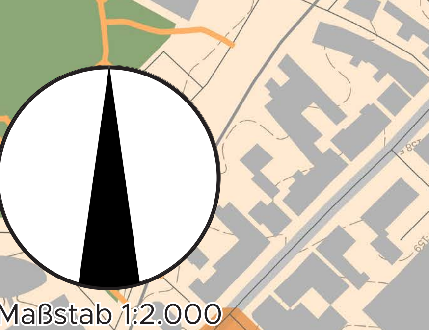
31 Der Spielplatz verfügt lediglich über ein Spielgerät und besitzt auch gestalterisch ein geringes Niveau. Die Fläche und die Lage bieten Potenzial für eine Aufwertung.