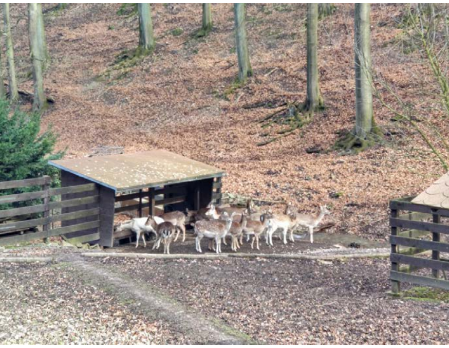
25 Das Rehgehege befindet sich im Wald und ist kostenlos zu jeder Tageszeit besuchbar. Neben den Rehen sind auch Muffins zu beobachten.