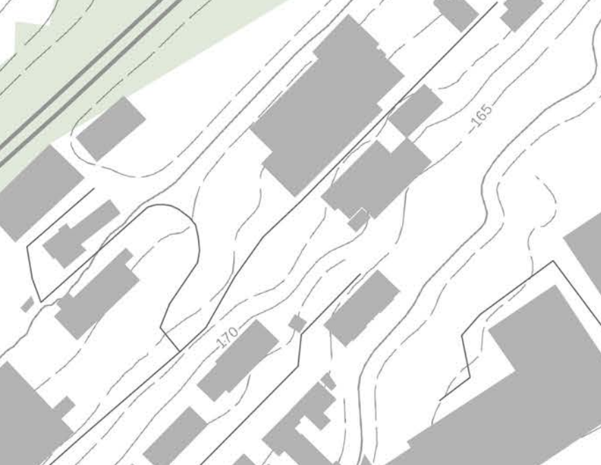
29 Die Kleingartenanlage erstreckt sich parallel zu den Schienen im Süden. Durch die lineare Struktur wird der durch Lärmmissionen belastete Bereich sinnvoll genutzt.